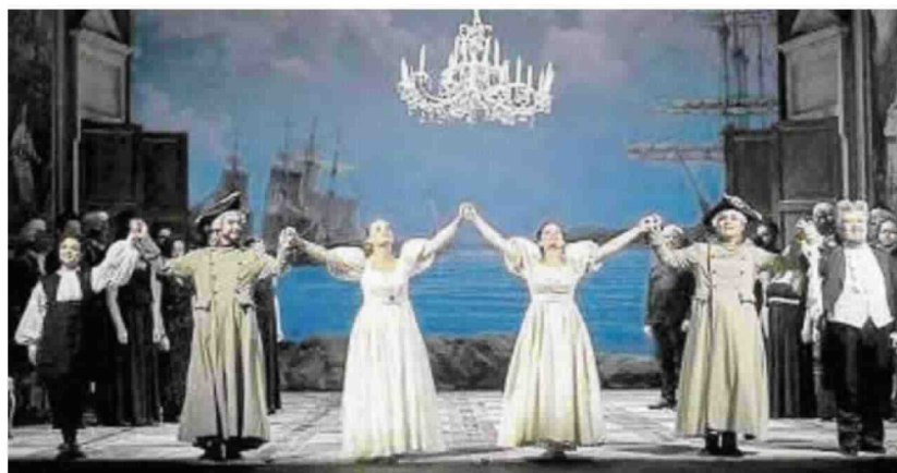
Una scena dal "Così fan tutte" per la regia di Ferrara

L'OPERA BUFFA DI MOZART PER LA REGIA DI FERRARA RICEVE APPLAUSI A SCENA APERTA